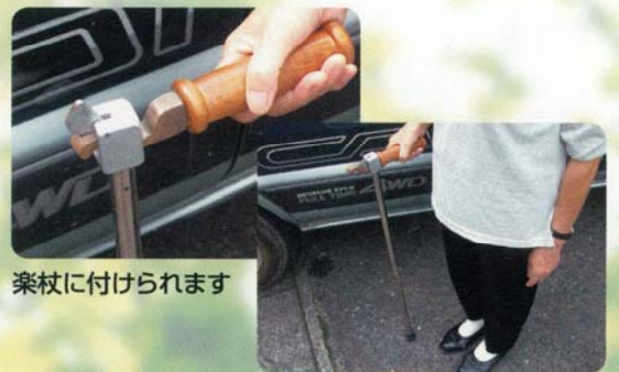
楽杖に付けられます